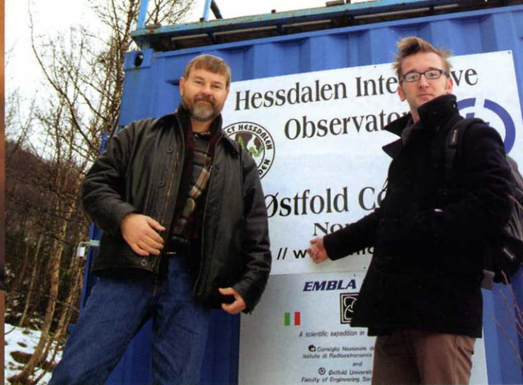
Links: Bij Thor! Onze man op bezoek bij de schepen van Toerisme van Ålen.