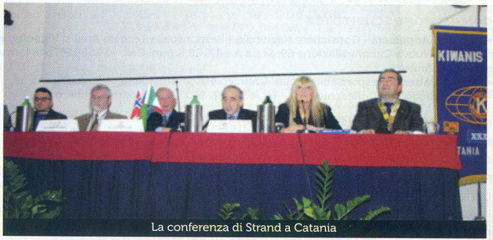
La conferenza di Strand a Catania