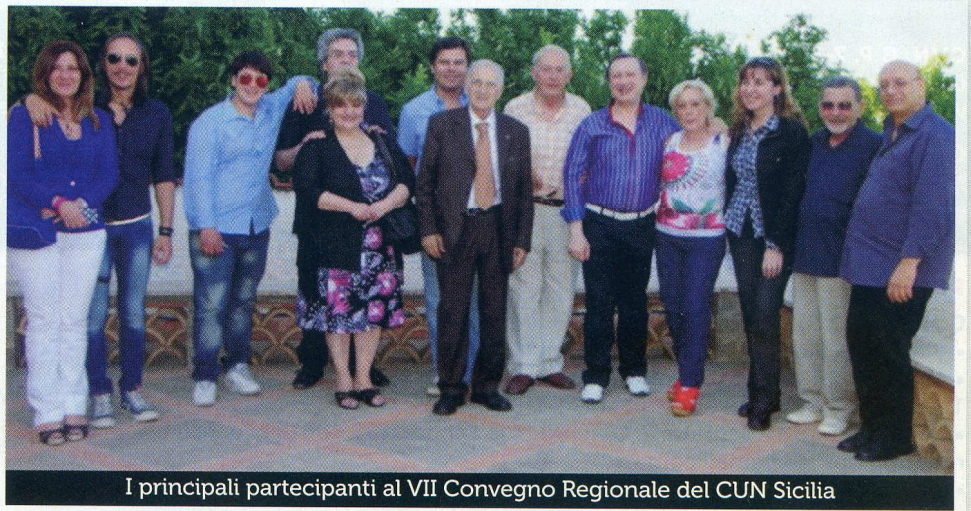
I principali partecipanti al VII Convegno Regionale del CUN Sicilia