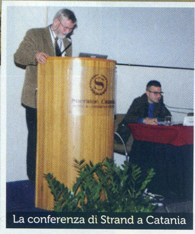
La conferenza di Strand a Catania